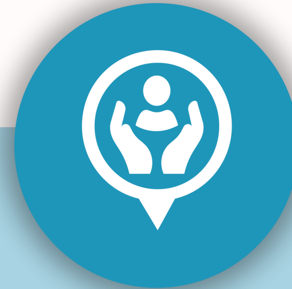
03 Pro bono